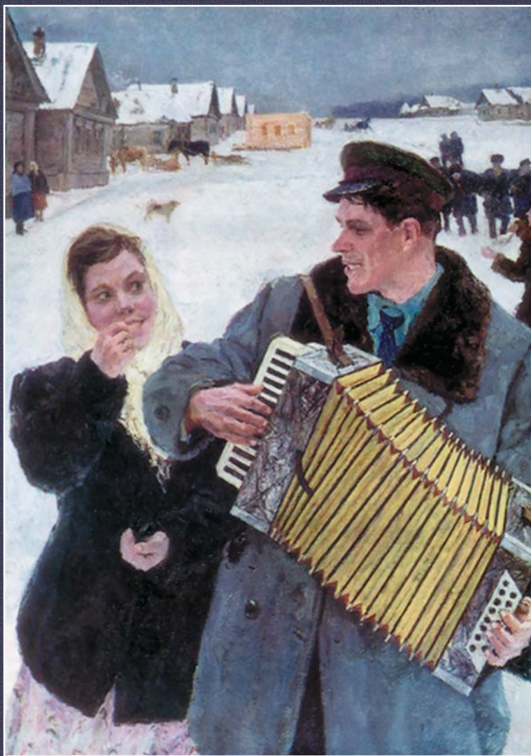
Аркадий Пластов. Молодые. 1955–1957